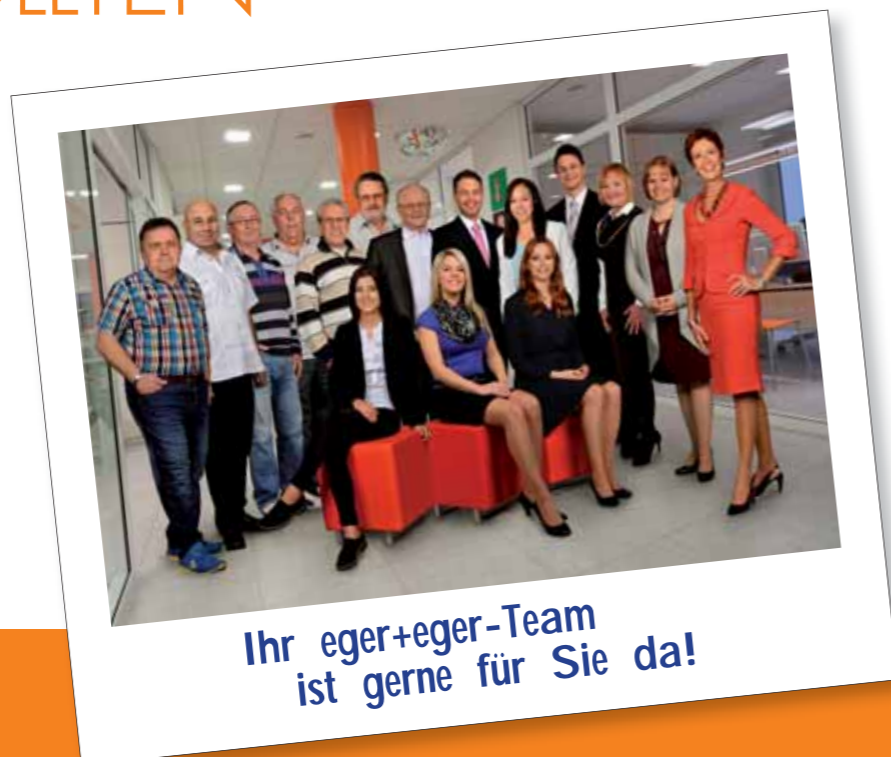
Ihr eger+eger-Team ist gerne für Sie da!