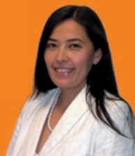
Akmaral Planner Allgemeine Verwaltung